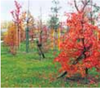
Herbstliche Impression im Park an der Randowstraße

Die Folgen des demografischen Wandels werden meist in düsteren Farben geschildert: Überalterung der Gesellschaft, steigende Kosten im Gesundheitssystem und dergleichen. Ein gleich bleibend niedriges Niveau bei den Geburtenraten - in Deutschland 1,36 Geburten pro Frau - hat viele Kitas und Schulen überflüssig gemacht. Sie wurden abgerissen. An diesen Orten sind grüne Oasen oder Stadtplätze mitten in den Wohnkiezen entstanden, die so genannten Quartierparks. Einige hunderttausend Quadratmeter wurden in den letzten Jahren in