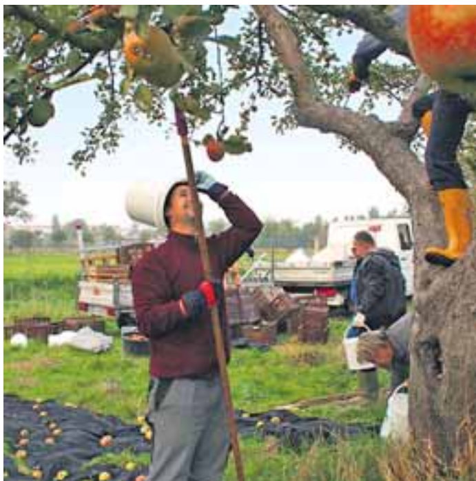
Apfelernte auf der Altobstanlage Falkenberg

Dülmener Rosenapfel, Rote Sternrenette, Londonpepping, Danziger Kantapfel, McCount – geradezu endlos die Liste wohlklingender Namen alter und regionaler Apfelsorten. Etwas ungeohnt vielleicht, denn in den Regalen der Supermärkte findet man nur noch Golden Delicious, Elstar, Lady Pink und vielleicht noch zwei, drei andere aus China, Australien oder Neuseeland, in den meisten Fällen aber aus industriellem Plantagenanbau.