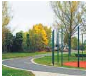
Noch wird gebaut am Quartierpark Neubrandenburger Straße

Lichtenberg umgestaltet, und es geht weiter. Für solche Vorhaben wurden bislang fast zwei Millionen Euro von der öffentlichen Hand investiert. Der Quartierpark Randowstraße in Neu-Hohenschönhausen ist einer von ihnen. Auf 14.000 Quadratmetern ist ein Wäldchen inmitten der umliegenden Häuser entstanden.