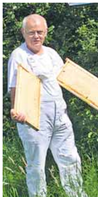
Die Waben müssen nun sorgfältig entdeckelt werden

Bei der Beurteilung der Qualität werden zwei Kriterien herangezogen: Das sichtbare äußere und das innere. Äußerlich erkennbar sind die Farbe des Honigs, sein-