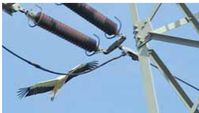
Freileitungen bedeuten ständige Gefahr für die Störche

In Malchow brüten Weißstörche seit 1971 auf einem alten Schornstein in der Dorfstr. 36. Im Jahr